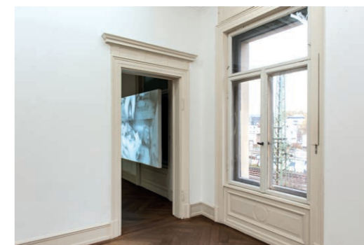
i, j Blick aus dem Zwischenraum in die anderen zwei Räume